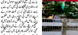
محکمانہ کارروائی شروع وجہ بتاؤ نوٹس جاری

راپنجی ڈویژن میں دیہی پوسٹل ورکر کے خلاف محکمانہ کارروائی شروع کی گئی۔ وجہ بتاؤ نوٹس جاری کیے گئے۔