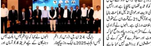
ایکس دہندگانوں کے لئے بنائی جا رہی ہے آسان انکم ٹیکس ایکٹ

ایکس دہندگانوں کے لئے بنائی جا رہی ہے آسان انکم ٹیکس ایکٹ۔ حکومت نے اس ایکٹ کو منظور کیا ہے۔