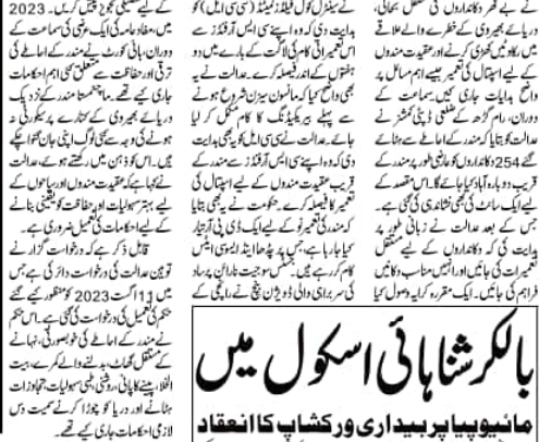
25/ اپریل سے جھارکھنڈ کے کئی اضلاع میں باش کامکان

بلاکسر شاہانی اسکول میں مانیو پیپریا پیداری ورکشاپ کا انعقاد کیا گیا۔ اس ورکشاپ میں مانیو پیپریا کی پیداری کے بارے میں معلومات دی گئیں۔