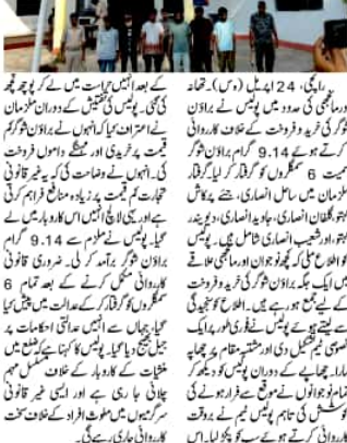
اسمگلر گرفتار، جیل رسید

راہی، 24 اپریل (دن)۔ مقامی پولیس کی ایک ٹیم نے برائون شوگر کے ساتھ پوس کی بڑی کامیابی حاصل کی۔ اسمگلر گرفتار ہوئے اور انہیں جیل بھیجا گیا۔