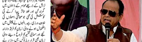
وزیر عرفان انصاری نے یوٹوب چینل کو 10 کروڑ روپے کا ہفتک عزت نوٹس بھیجا

وزیر عرفان انصاری نے یوٹوب چینل کو 10 کروڑ روپے کا ہفتک عزت نوٹس بھیجا۔ انہوں نے اس کے خلاف کارروائی کرنے کا حکم دیا۔