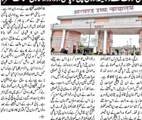
ہائی کورٹ کے ذریعہ اردن پتی تپائی اور اردن نماری ضمانت منسوخ

ہائی کورٹ نے بے گھر دکانداروں کی مستقل بحالی کا حکم دیا۔ جھارکھنڈ شراب گھوٹالہ کی وجہ سے بے گھر ہوئے دکانداروں کی بحالی کے لیے یہ حکم دیا گیا۔